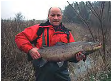
Naturprojekterne i Kolding Ådal har forbedret levevilkårene for havørreden.

Turen til Truds Å erstatter den planlagte tur til Vester Nebel Å. Den tur er aflyst på grund af de store mængder regn, der er faldet på det seneste.