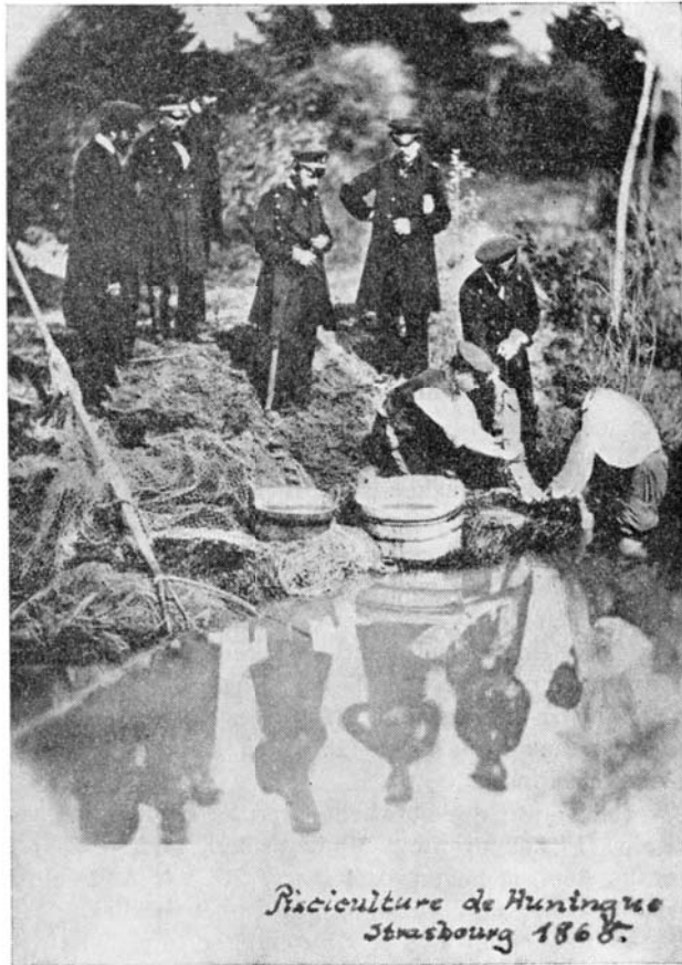
Pisciculture de Hüningen Strasbourg 1868.

Fig. 2. Dette Billede er rimeligvis det ældste eksisterende Fotograf, der er taget af en Afstrygningsproces (ved en af Rhinens Bifloder i 1868). De tilstedeværende Personer er Funktionærer fra Klækkeanstalten Hüningen, der er iført Uniformer for l'Administration des Ponts et Chaussées, hvorunder Klækkeanstalten sorterede. (Negativet til Billedet er til Brug for denne Artikel udlånt af dr. P. Vivier (Chef for Fiskeriundersøgelserne ved den franske Service des Eaux et Forêts), som har faaet det overdraget af dr. W. Koch, Karlsruhe).